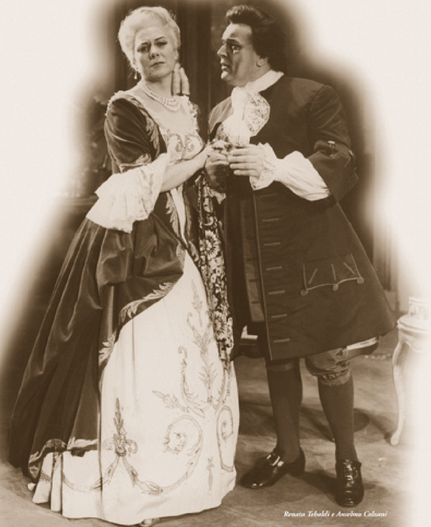
Renata Tebaldi e Anselmo Colzani

Teatro Consortiale di Budrio - Via Giuseppe Garibaldi, n. 35 - 40054 Budrio (Bologna - Italia) Termine iscrizioni entro 30 aprile 2011